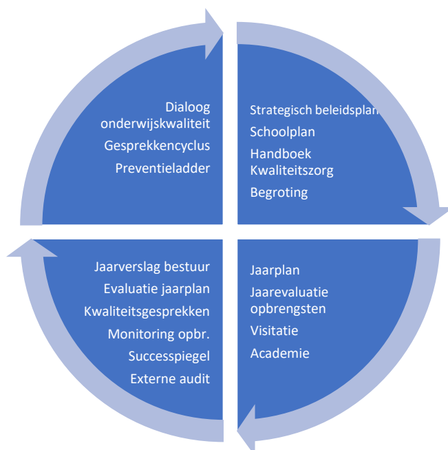
FIGUUR 1. KWALITEITSCYCLUS VCO OOST-NEDERLAND.

In het Handboek Kwaliteitszorg VCO Oost-Nederland staat beschreven hoe het bestuur zicht houdt op onderwijskwaliteit. Dit handboek bevat een kwaliteitscyclus (zie Figuur 1). Deze cyclus beschrijft het beleid en de activiteiten die bijdragen aan het continue verbeteren van de kwaliteit van het onderwijs. Een en ander is verder uitgewerkt in het Handboek Kwaliteitszorg VCO Oost-Nederland.